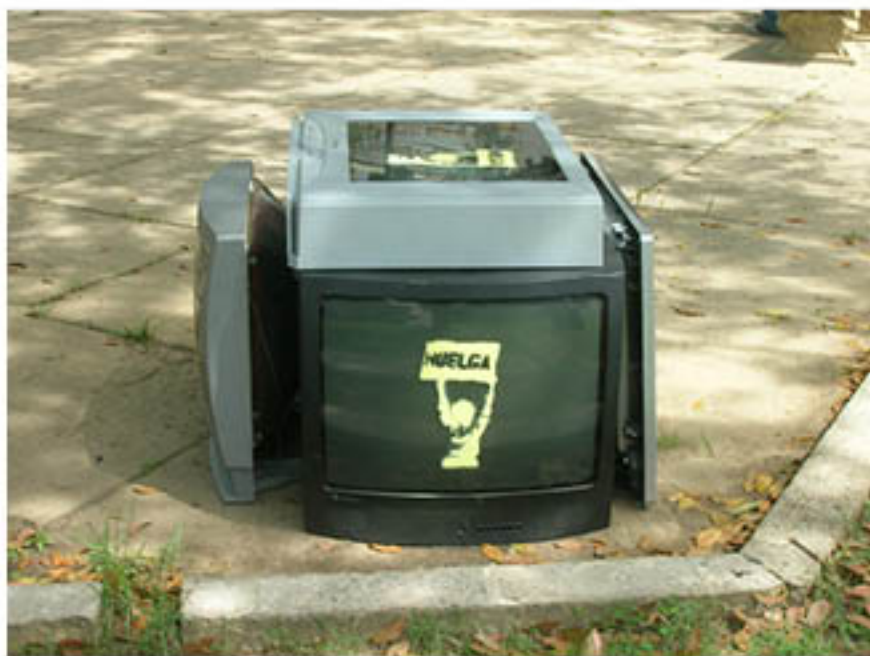
EDEN BASTIDA KULLICK (México) TV Estencil I, 2010 Digital print on single weight board, 9½" x 14"